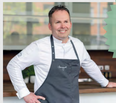
Martina van Kann Fotografie